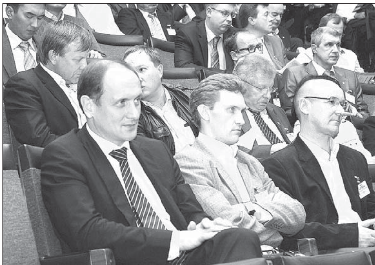
В зале – известные хирурги стран СНГ

Симпозиум «Новое в диагностике и лечении хирургических заболеваний печени, желчных путей и поджелудочной железы» начался с доклада директора Федерального научного центра трансплантологии и искусственных органов им. В.И.Шумакова члена-корреспондента РАМН Сергея Готье «Хирургические аспекты трансплантации печени – 20-летний опыт». И здесь надо признать, что своим колоссальным трудом известный хирург отработал технологии для трансплантации, которые имели большое значение для резекционной хирургии печени.